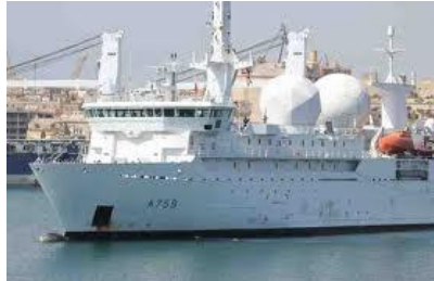
仏海軍「デュブ・デ・ロン」(艦番号A-759、全長101m) (4月11日付C紙12面)