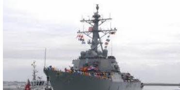
米海軍「ドナルド・クック」(艦番号74、全長154m)

10日、米海軍「ドナルド・クック」(艦番号74、全長154m)は、チャナッカレ海峽を北上し、黒海へ向かった。同日16時頃、仏海軍「デュブ・デ・ロン」(艦番号A-759、全長101m)も同様に黒海へ向かった。